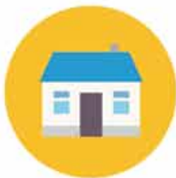
Asuntokauppa- ja kiinteistöasiat

Olemme joustavia ja avoimia. Asiakslähtöisyys ja läpinäkyvyys eivät ole meille vain sanoja vaan ne näkyvät myös kaikissa teoissamme. Ammattitaitomme on se, josta meidät asiakkaidemme keskuudessa parhaiten tunnetaan. Asiakkaitamme ovat yritykset, yksityishenkilöt ja julkisyhteisöt – kaikki yhtä tärkeitä.