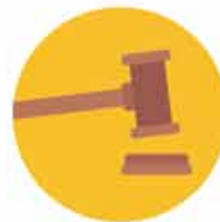
Oikeudenkäynnit ja välimiesoikeudenkäynnit

Kokeile ilmaisia kiinteistökaupan asiakirjojamme