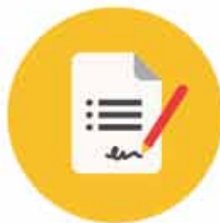
Sopimus- ja liikejuridiikka